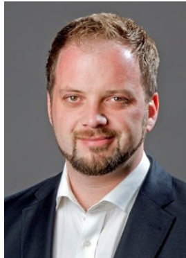
Oberbürgermeister Tobias Eschenbacher