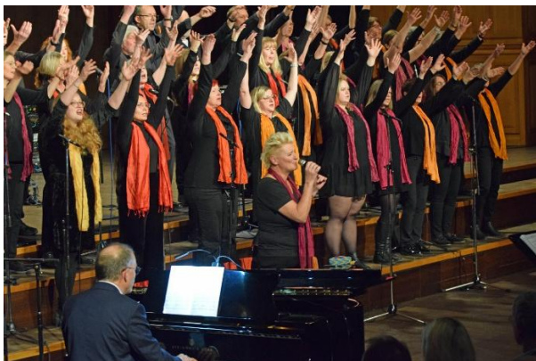
Benefizchorkonzert „Frei-SING(T)“ 2024.