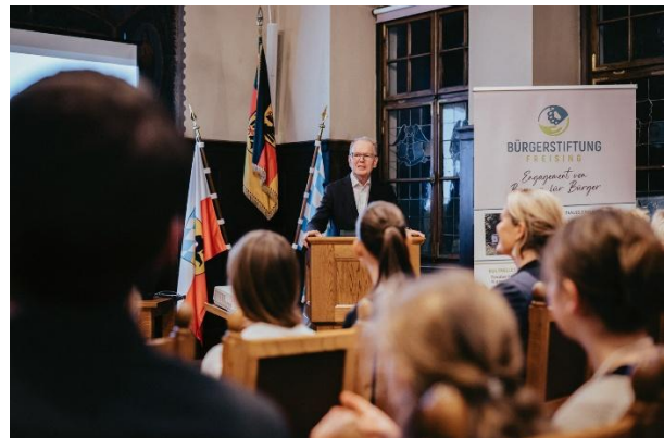
Herbsttreffen 2024 mit Preisverleihung Wettbewerb Klima-Schulprojekt 2024.