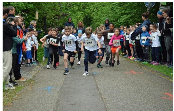
11. Weihenstephaner Panoramalauf 2024