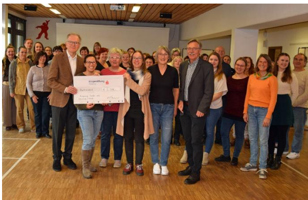
Scheckübergabe an „freysing larks“.