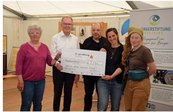
Scheckübergabe „Mein Liebster Platz“ – Uferlos 2024.