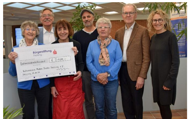
Scheckübergabe an „modern studio freising“.