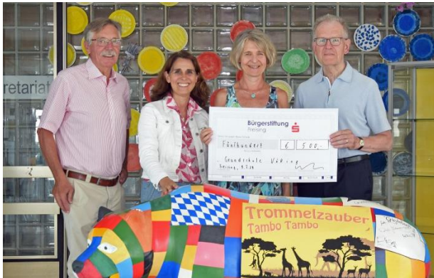
Scheckübergabe an die Grundschule Vötting.