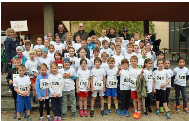
11. Weihenstephaner Panoramalauf 2024.