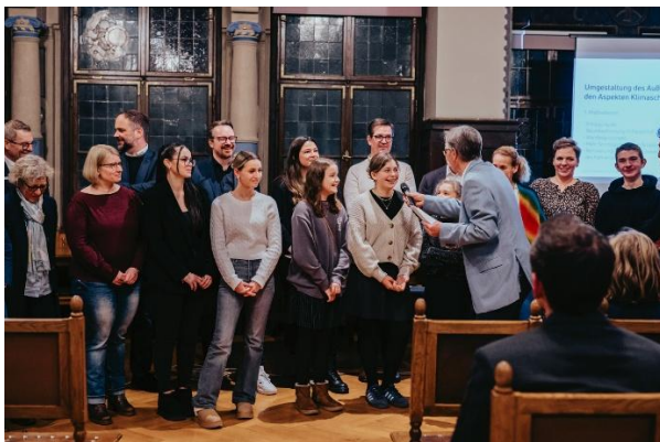
Herbsttreffen 2024 mit Preisverleihung Wettbewerb Klima-Schulprojekt 2024.