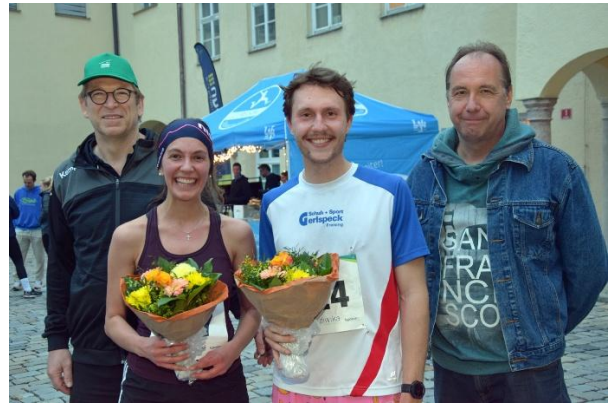
11. Weihenstephaner Panoramalauf 2024