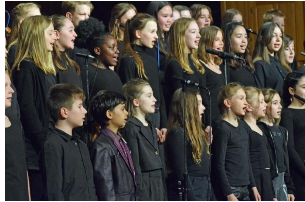
Benefizchorkonzert „Frei-SING(T)“ 2024.