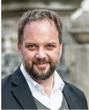
Oberbürgermeister Tobias Eschenbacher (Schirmherr)