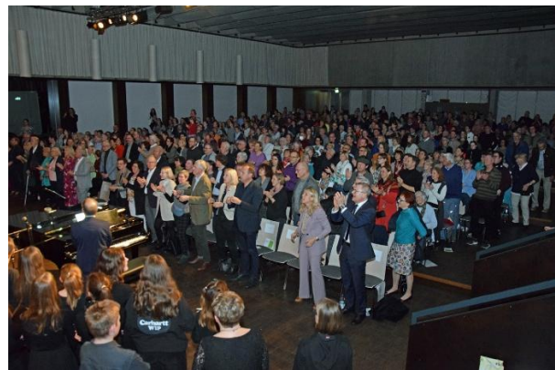
Benefizchorkonzert „Frei-SING(T)“ 2024.