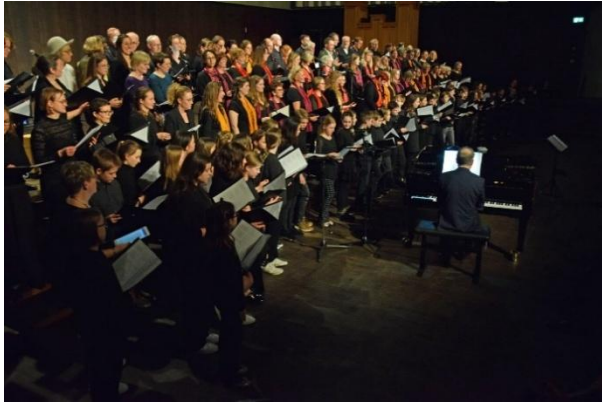
Benefizchorkonzert „Frei-SING(T)“ 2024.