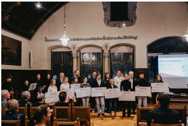
Herbsttreffen 2024 mit Preisverleihung Wettbewerb Klima-Schulprojekt 2024.