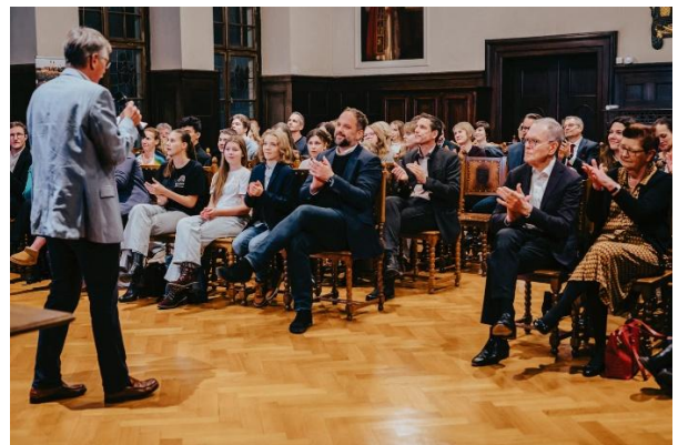
Herbsttreffen 2024 mit Preisverleihung Wettbewerb Klima-Schulprojekt 2024.