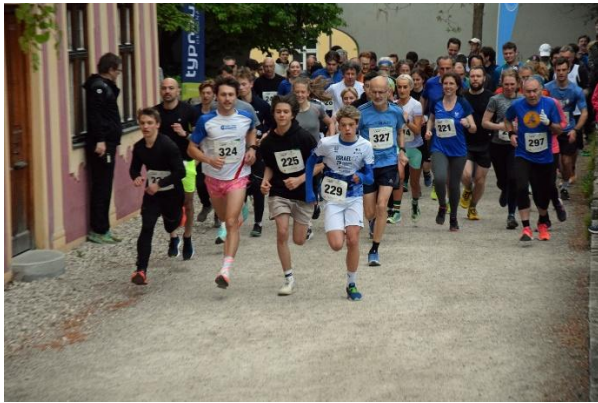
11. Weihenstephaner Panoramalauf 2024.