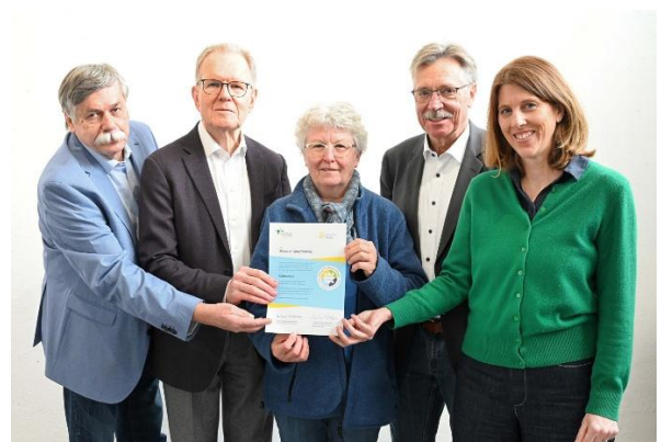
Regionaltreffen des Bündnisses der Bürgerstiftung Deutschlands. Übergabe Gütesiegel.